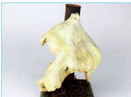
SCHWEFELPORLING Laetiporus sulphureus Bestell Nr. 036