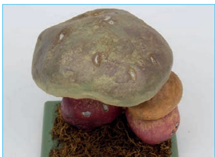
SATANSPILZ, SATANSRÖHRLING Boletus satanas Bestell Nr. 032