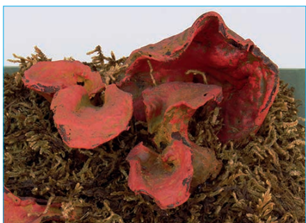
ROTER GALLENRICHTERLING Tremiscus helvelloides Bestell Nr. 025