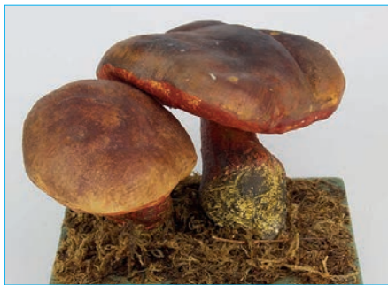
SCHUSTERPILZ, FLOCKEN- STIELIGER HEXENRÖHRLING