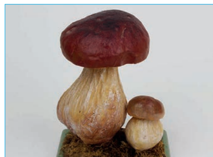
STEINPILZ Boletus edulis Bestell Nr. 030