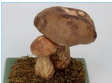
GALLENRÖHRLING Tylopilus felleus Bestell Nr. 023