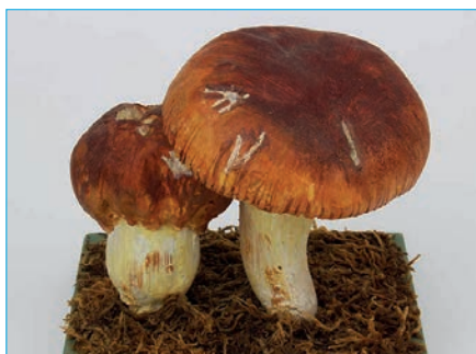
STINKSTÄUBLING Lycoperdon foetidum Bestell Nr. 020