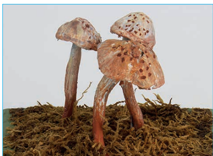
GEFLECKER RÜBLING, BITTER RÜBLING Collybia maculata Bestell Nr. 022