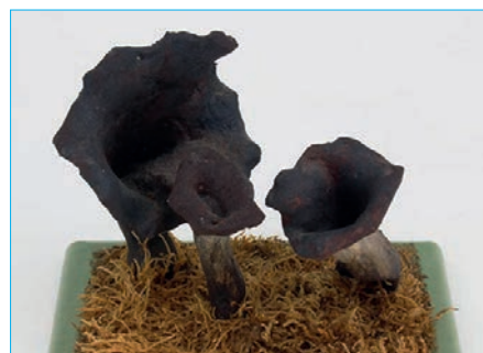
TOTENTROMPETE, HERBSTTROMPETE Craterellus cornucopiodes Bestell Nr. 037