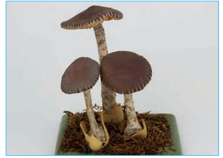
SCHEIDENSTREIFLING Amanita vaginata Bestell Nr. 059