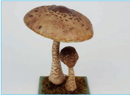
PARASOL, RIESENSCHIRMPILZ Macrolepiota procera Bestell Nr. 056