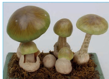
GÜNER KNOLLENBLÄTTERPILZ Amanita phalloides Bestell Nr. 024