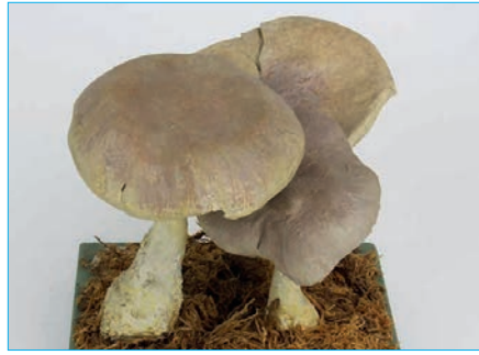
NEBELGRAUER TRICHTERLING Clitocybe nebularis Bestell Nr. 057