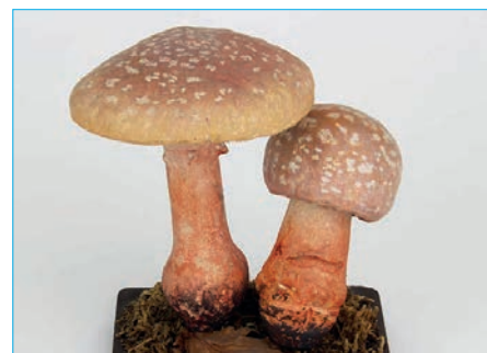
PERLPILZ, RÖTENDER WULSTLING