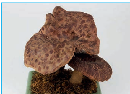
HABICHTSPILZ Sarcodon imbricatus Bestell Nr. 035