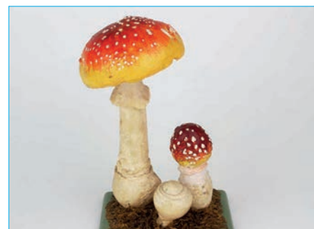
FLIEGENPILZ Amanita muscaria Bestell Nr. 027