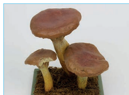
GROSSER GELBFUSS, KUHMAUL

Infundibulicybe geotropa Bestell Nr. 008