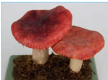
SPEITÄUBLING Russula emetica Bestell Nr. 029