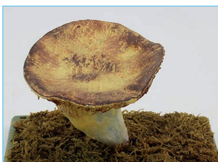
FAHLGELBER TRICHERLING, MÖNSCHKOPF

Infundibulicybe geotropa Bestell Nr. 008