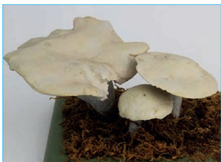
MEHLPILZ Clitopilus prunulus Bestell Nr. 028