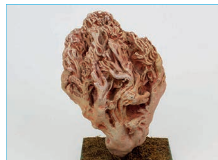
BAUCHWEHKORALLE, BLEICHER Ramaria pallida Bestell Nr. 021