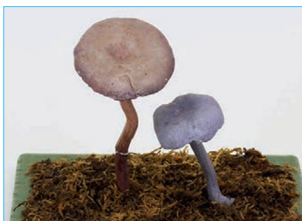
BLÄULING, BLAUER LACKTRICHTERLING