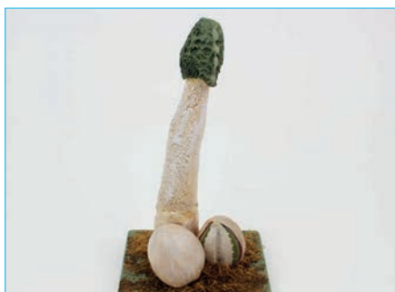
STINKMORCHEL Phallus impudicus Bestell Nr. 033