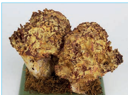
KRAUSE GLUCKE, FETTE HENNE