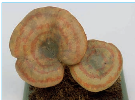
ECHTER REIZKER Lactarius deliciosus Bestell Nr. 026