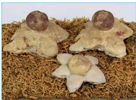
FRANSENERDSTERN Geastrum fimbriatum Bestell Nr. 019